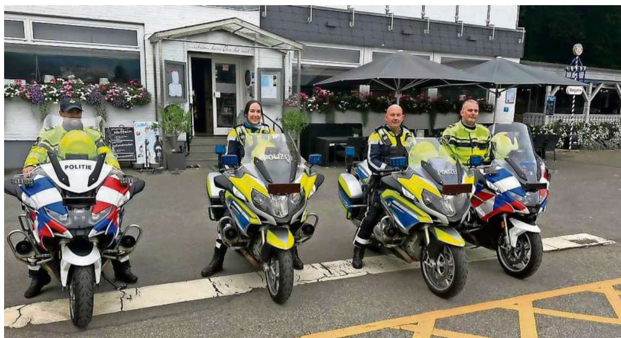
Grenzübergreifendes Kontrollteam: Die Polizeikräfte aus Düren hatten Unterstützung aus den Niederlanden.